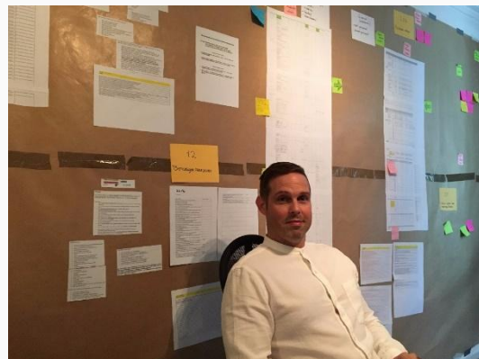
War room sessies bij Roeters